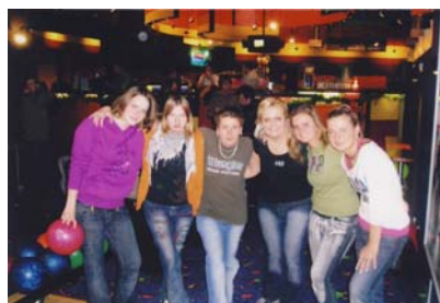
Bowling v Olympii