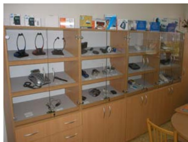
Půjčovna kompenzačních pomůcek