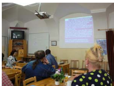
Simultánní přepis mluveného slova