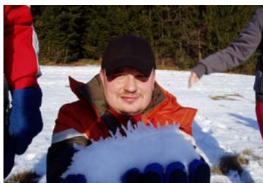
Zimní pobyt v Kněhyni