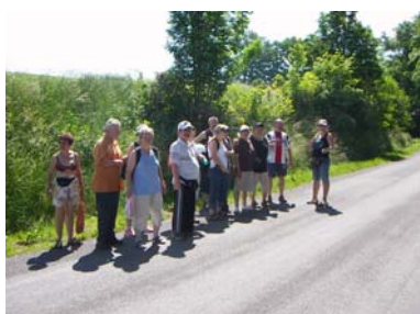
Túra v Heřmanicích

Organizovali jsme rekondiční pobyt v Heřmanicích, kterého se zúčastnilo celkem 42 lidí. Pobyt přinesl lidem spoustu zážitků.