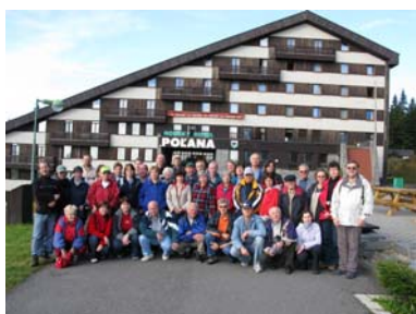
Rekondiční pobyt na Polaně

V roce 2007 se uskutečnil týdenní rekondiční pobyt v červenci, a to na Malé Morávce v Jeseníkách. Zúčastnilo se jej 43 neslyšících. Kromě toho se uskutečnily dva víkendové edukační pobyty: pobyt pro účastníky kurzů ZJ s neslyšícími v květnu na Soláni v Beskydech a pobyt v září na Polaně ve Slovenském Rudohoří.