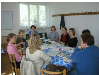
Kurzy ZJ v Ostravě

znakové zásoby prostřednictvím společně tráveného času s neslyšícími lektory. Pobyt se uskutečnil ve dnech 25. – 27. května 2007 v krásném valašském prostředí, v hotelu Luka ve Velký Karlovicích – Na Soláni. Víkendem nás provázelo opravdu letní počasí.