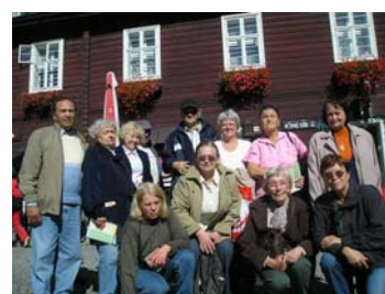
Pobyt na Karlově Studánce