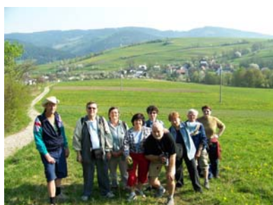
Túra v Beskydech