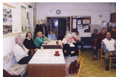
Beseda v centru na sociální téma