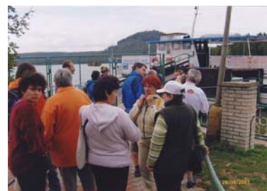
Výlet na parníku - Doksy