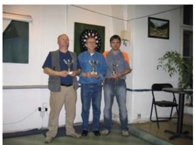
Vítězové poháru šípek...

Kluby Joker a šípek se zúčastňovaly neprofesionálních sportovních soutěží. Pravidelně v naší organizaci byly pořádány i malé turnaje a soutěže. Pražská organizace se zhostila organizování Turistů bez hranic, zájemci se mohli projít krásami přírody Prahy.