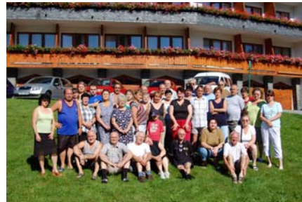
Rekondiční pobyt v Jeseníkách