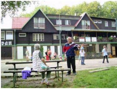
Pobyt seniorů na Tesáku