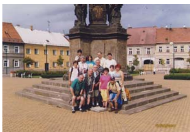
Náměstí v Doksech