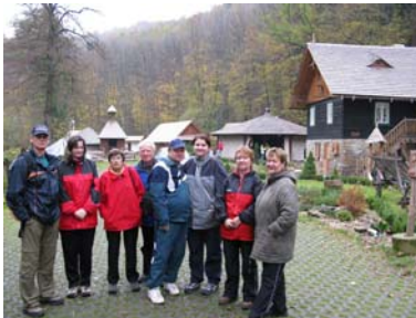
Túra na Polaně