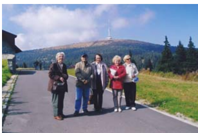
Pohled na Praděd

V červnu proběhl rekondiční pobyt v Lázních Luhačovice. Pobytu se zúčastnili mladí neslyšící i dříve narození. Kromě zajištění léčebných procedur v Solné jeskyni, jsme si vyzkoušeli pitný režim prameny Vincentka, v Ottovce léčení průdušek a dýchacích cest. Dále byly organizovány vycházky, koupání a zájezd na hrad Buchlov. V červenci, v nejteplejším období roku, jsme odjeli do Štědrónína na Orlické přehradě. Neslyšící, kteří s námi jeli, byli všech věkových kategorií. V září proběhl rekondiční pobyt v lázních Karlova Studánka, který byl vyhrazen pro seniory.