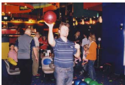
Bowling v Olympii