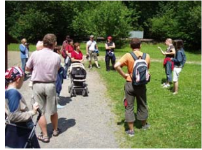
Pobyt v Beskydech