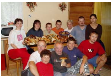
Houbaření na pobytu v Bečvě

Uspořádali jsme pobytovou akci pro sluchově postižené v Prostřední Bečvě, zimní pobyt tamtéž. Zúčastnili jsme se také rehabilitačně – sportovního pobytu na Jelenovské.