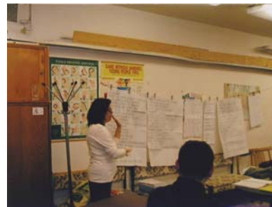
Kurz ZJ v Brně