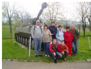
Návštěva vojenského muzea