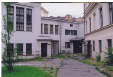
Vchod do centra soc. služeb

Pracovníci průběžně informovali klienty o Zákoně o sociálních službách, zajišťovali tlumočnické služby. Dále probíhaly přednášky na sociální témata. V průběhu roku se podařilo připojit oblastní centrum na internet.