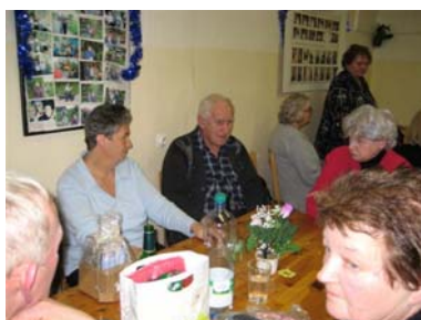
Rozlučka s rokem 2007