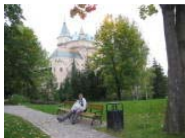
Prohlídka zámku Bojnice