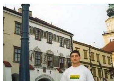
Pohled z náměstí