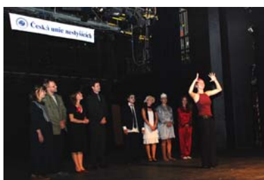
Moderátoři jubilejního ročníku