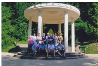
Pobyt Lázně Luhačovice