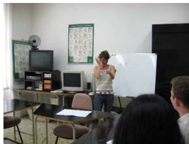
Kurzy znakového jazyka