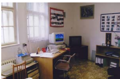
Kancelář centra soc. služeb