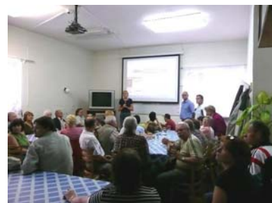
Přednáška tlumočená do ZJ