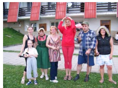
Víkendový pobyt se studenty ZJ