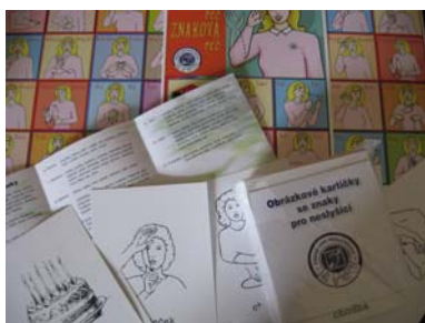
Kartičky a pexeso se znaky

V roce 2007 byly obnoveny kartičky se znaky pro neslyšící. Graficky se upravily původní výtisky a vyrobily se na kvalitnější papír. Dále jsme připravili pexeso se znakovou řečí.