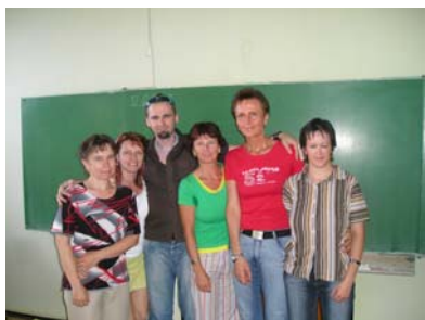
Kurzy znakového jazyka v Třebíči

Kurzy znakového jazyka probíhaly v Brně a v Třebíči na Střední zdravotnické škole. V červnu 2007 zakončilo kurzy zkouškou celkem 48 účastníků.