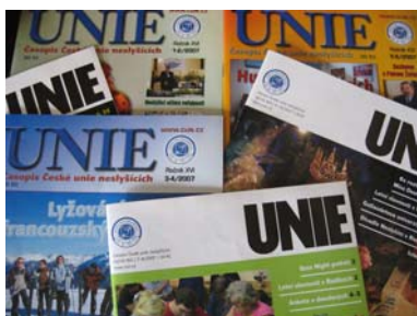
Časopis UNIE 1-12/07

Pro ZP neslyšící je i zdrojem orientace na duševní zdraví, životní hodnoty a zvýšení jejich zájmů o věci veřejné. Dále je vhodným informačním zdrojem k čerpání materiálů pro studenty středních a vyšších odborných škol se sociálně právním zaměřením k problémům ZP neslyšících občanů.