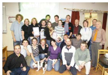
QUIZ NIGHT na podporu časopisu