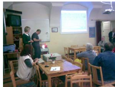
Předn. o kompenz. pom. v Praze