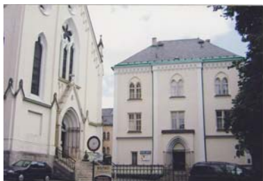
Areál Klášter, ul. s budovou centra

Druhým rokem v nových prostorách centra denních služeb se dařilo plnit aktivity pro osoby se zdravotním postižením. Stále trvají problémy v zajištění tlumočnicka a sociální pracovnice.