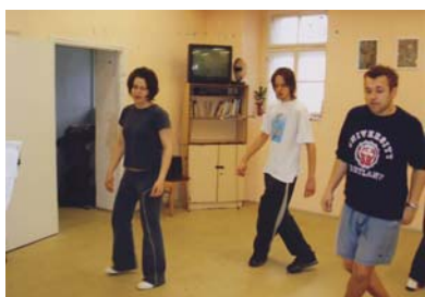
Aerobik v prostorách centra sociálních služeb

Celoročně se pořádala soutěž v šípkách a kartách „Joker“. Dívky pořádaly celoročně aerobik a kondiční cvičení.