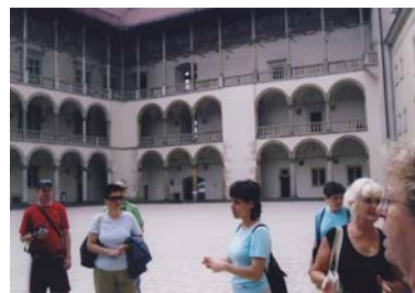
Poznávací zájezd Krakov (Polsko)