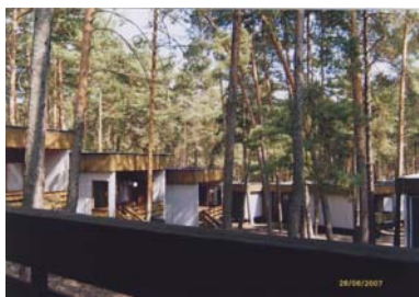
Chatky Staré Splavy

Uspořádali jsme pobytovou akci pro sluchově postižené ve Starých Splavech u Doks pro 20 osob.