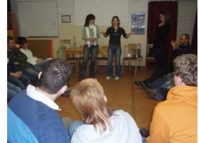
Přednáška o školství na Slovensku