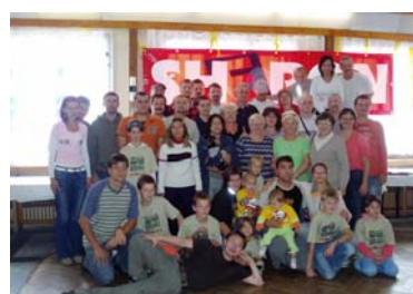
Pobyt na Jelenovské