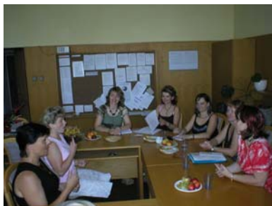
Zkoušky ZJ ve Val. Meziříčí