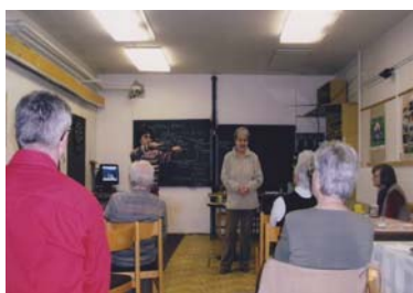
Přednáška Brno dříve a dnes

Pořádané přednášky, exkurze, besedy o městě Brně, které byly tlumočeny do znakového jazyka, umožňovaly sluchově postiženým získat informace, ke kterým by jinak neměli přístup. Důležité jsou také prostory, kde se mohou přednášky konat. Neslyšící jsou ve společnosti sobě rovných lidí, necítí se osamoceni a neuvědomují si tak svoje postižení.