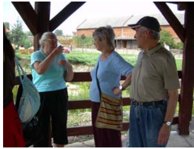
Pobyt seniorů na Tesáku