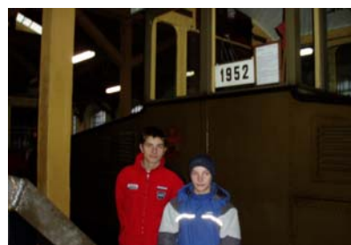
Návštěva muzea – tramvaj z r. 1952