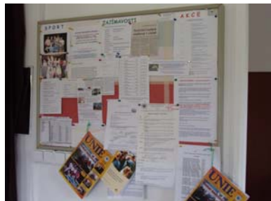
Informace o službách a akcích