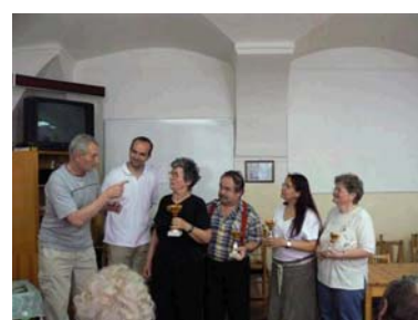
Předávání pohárů vítězům