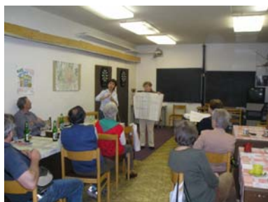
Přednáška o zdraví v Brně