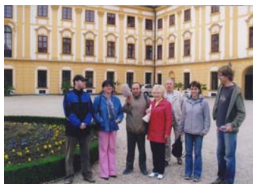
Poznávací zájezd Jaroměřice n/Rok.