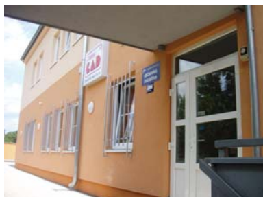
Budova centra soc. služeb ve Zlíně

Z důvodu nedostatku financí muselo dojít k úsporným opatřením. Dosavadní činnost – tradiční akce však probíhaly neomezeně. Podařilo se nám zajistit novou tlumočnicki.