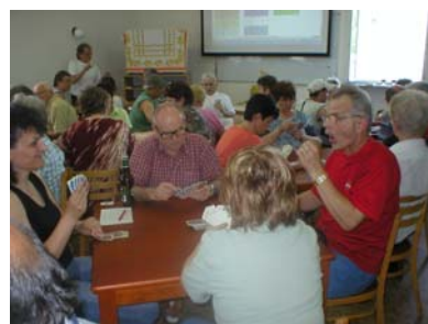
Turnaj v JOKERu