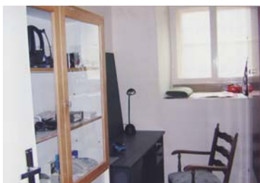
Kancelář centra soc. služeb