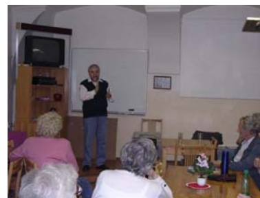
Přednáška na sociální téma