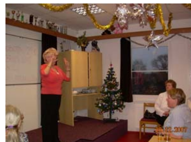
Vánoční posezení s klienty