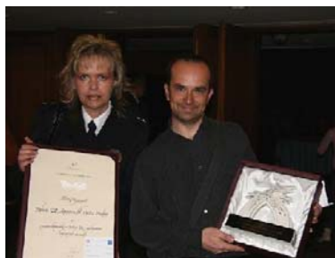
Udělování cen Mosty 2007