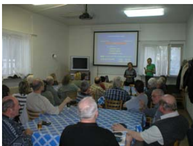
Přednáška o alergii v Ostravě

Realizace těchto přednášek z oblasti zdraví pomohla neslyšícím v jejich informovanosti, kterou jako osoby s těžkým zdravotním postižením jinde nezískávají. Přítomen byl tlumočnick znakového jazyka, který je nedílnou součástí práce s neslyšícími. Cílem bylo pomoci sluchově postiženým spoluobčanům dát pocit, že nestojí na okraji společnosti. Částečně jsme zajistili neslyšícím, pro jejich potřebu se sdružovat a setkávat se, podmínky, aby mohli komunikovat svým specifickým jazykem.