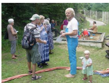
Letní slavnosti na podporu časopisu