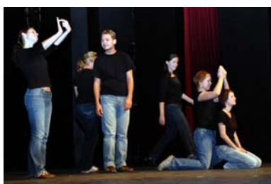
Vystoupení souboru Tichá hudba

Mezi nejvýznamnějších akce ústředí patřila opět divadelní přehlídka tvorby ve znakovém jazyce – Mluvící ruce. V roce 2007 proběhl jubilejní desátý ročník. Přehlídka se konala k Mezinárodnímu dni neslyšících a byla opět rozdělena do dvou částí. V první části vystoupily sluchově postižené děti, dále jednotlivci, zájmové kroužky a soubory, v druhé části vystoupili zahraniční hosté z řad neslyšících umělců. Představení doprovázeli neslyšící moderátoři z předcházejících devíti ročníků, kteří byli tlumočeni do mluveného slova. Přehlídky se zúčastnilo cca 300 osob.