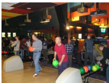
Bowling v Olympii

Soutěže v kuželkách, bowlingu, malé kopané mají pro neslyšící svoji specifikou. Nejde jen o samotné hráče, kteří se utkání účastní, ale i o neslyšící diváky. Po zápase jsou udělovány diplomy, upomínkové ceny, je provedeno hodnocení celé akce.