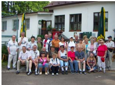
Rekondiční pobyt v Heřmanicích