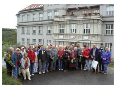
Turisté bez hranic