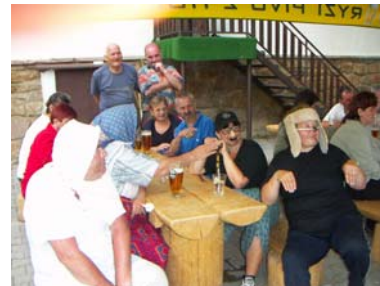
Rozlučka v Heřmanicích