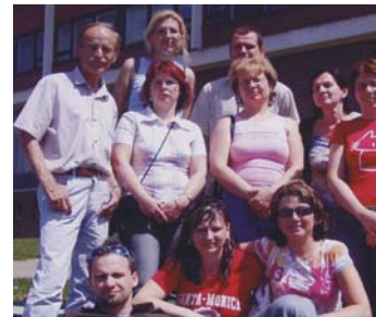
Školení lektorů ZJ