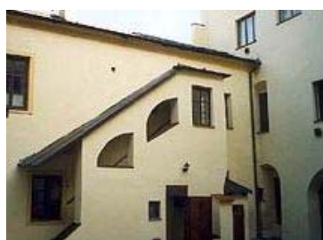
Budova centra soc. služeb